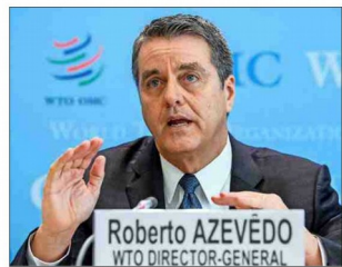
El director general de la OMC ayer en Suiza, donde indicó lo cercano que está una guerra comercial.

La confrontación arancelaria y retórica entre Estados Unidos y China pareció enfriarse este martes. Esto, luego de que el Presidente del país asidido anunciara una mayor apertura comercial de su país, en lugar de responder con más restricciones a su homólogo estadounidense, que todavía amenaza castigar con aranceles unos US$ 150 mil millones en importaciones chinas. Pero la posibilidad de una guerra comercial no ha quedado atrás, y eso lo dejó claro ayer el director general de la Organización Mundial de Comercio (OMC), el brasileño Roberto Azevêdo. El personero señaló que si bien "técnicamente" las dos mayores economías del mundo no están en una guerra comercial, "políticamente debemos estar viendo su inicio". Advirtió que hay medidas proteccionistas "que han sido anunciadas, pero todavía no se han aplicado". Y por lo tanto, pidió a las naciones involucradas evitar retribuciones "ojo por ojo" que pudieran terminar provocando un "escalamiento inmanejable".